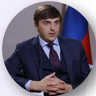
Сергей Кравцов Министр просвещения Российской Федерации

В рамках рабочей поездки в Нижний Новгород (2 марта, Нижний Новгород):