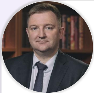
Александр Бугаев Первый заместитель министра просвещения Российской Федерации

О всероссийской молодёжной акции «Наши семейные книги памяти» (8 сентября, Москва)