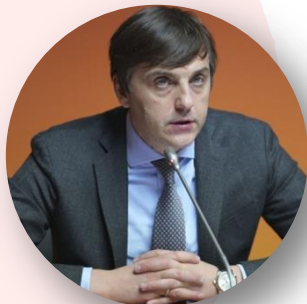
Сергей Кравцов Министр просвещения Российской Федерации

В ходе выступления на форуме «Билет в будущее» (Москва, 21 ноября):