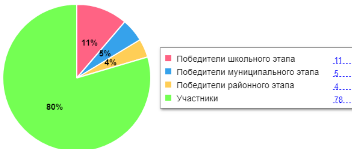
Диаграмма по результатам участия школьников во ВсОШ