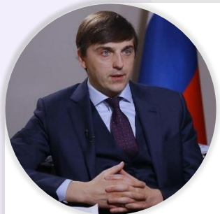
Сергей Кравцов Министр просвещения Российской Федерации