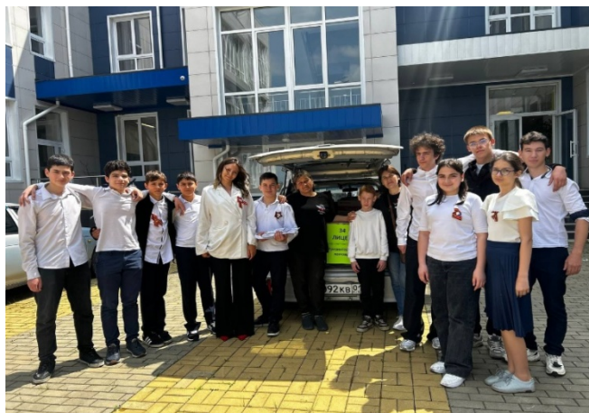
Рис. 2. Акция по сбору гуманитарной помощи в зону СВО, приуроченная ко Дню Победы, организованная 34 Лицеем г. Майкопа совместно с волонтерской организацией «Тихий Фронт» г. Майкопа